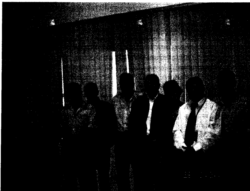
Sesión Final del Comité del Fideicomiso Agropecuario N° 191-2009 Miembros del Comité